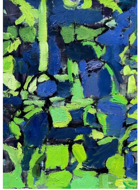
טבע דומם מפורק, 2024 שמן על בד, 40X30 ס"מ