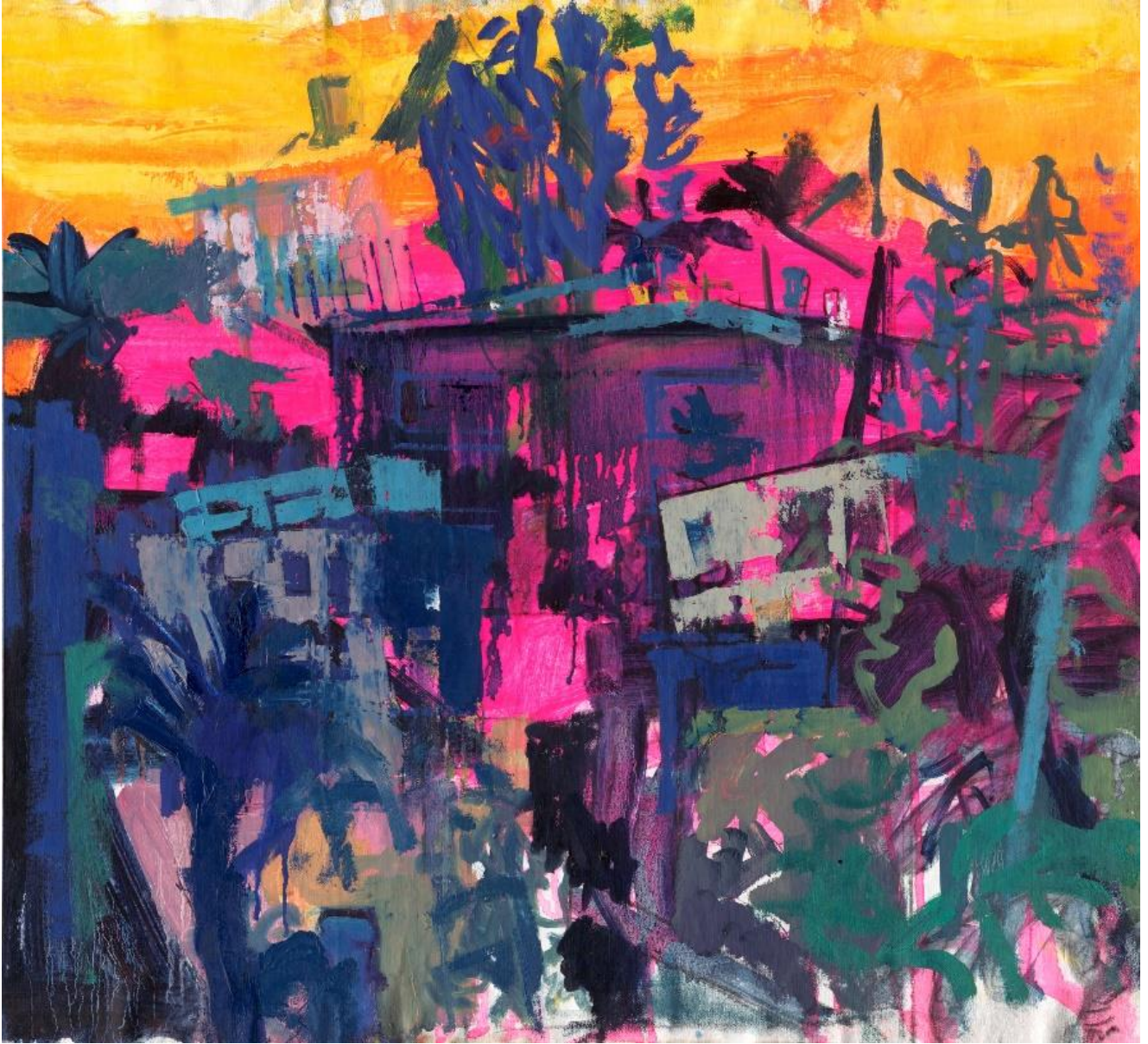
נוף עם שמים בצבעי שקיעה, 2024, שמן על בד, 50X60 ס"מ