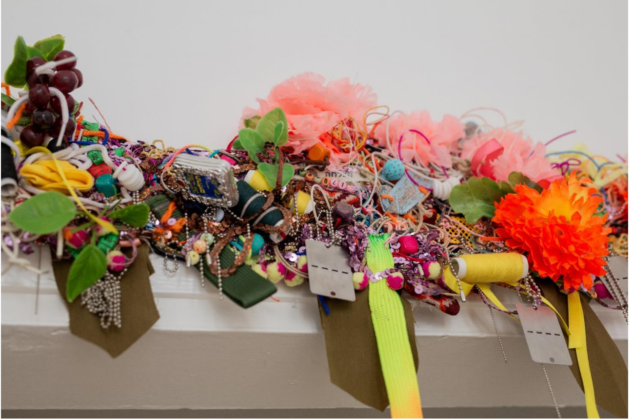
וישם לך שלום, 2017-2024, טכניקה מעורבת, 22X200 ס"מ