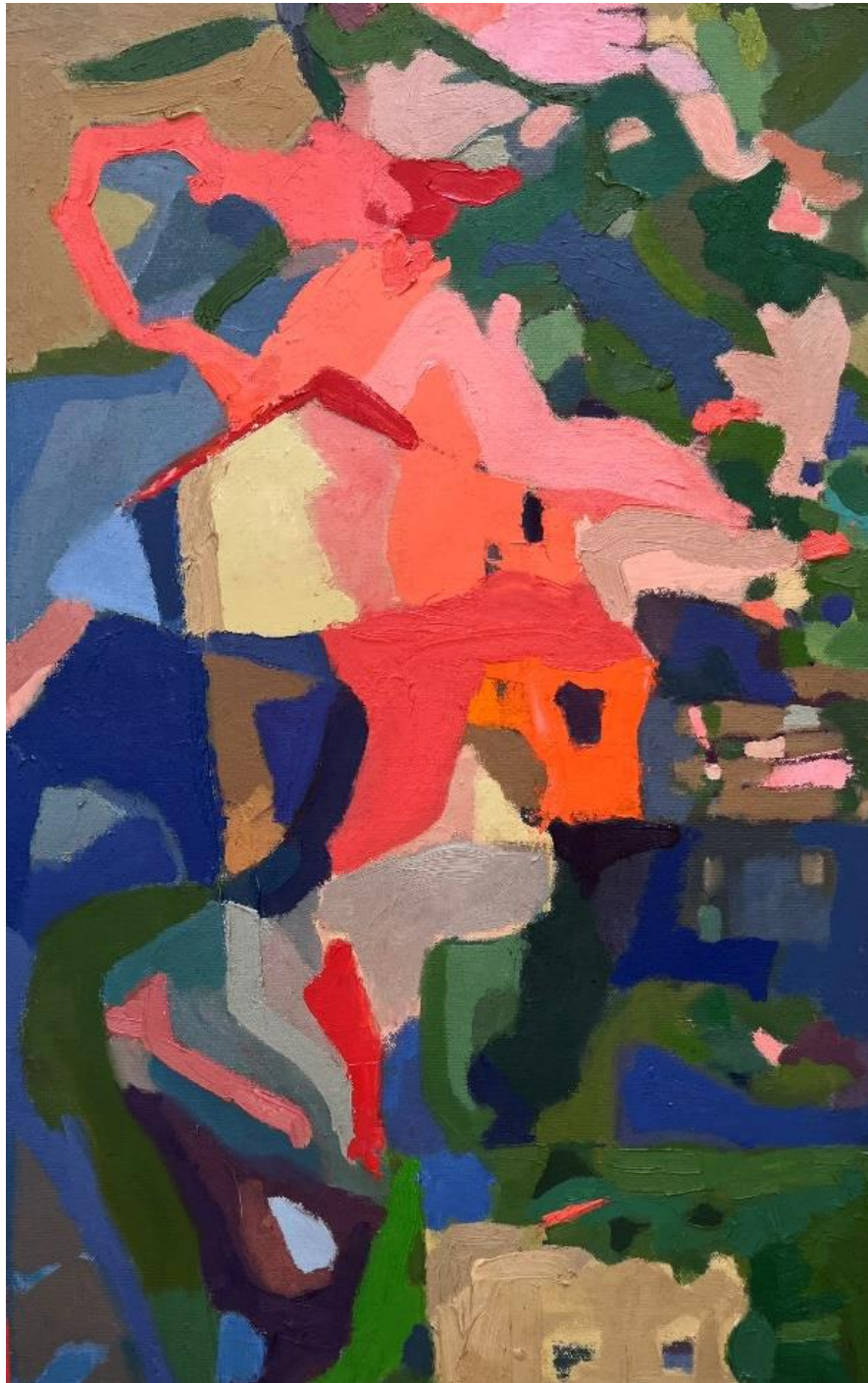
נוף מצויר לאורך, 2024, שמן על בד, 55X35 ס"מ