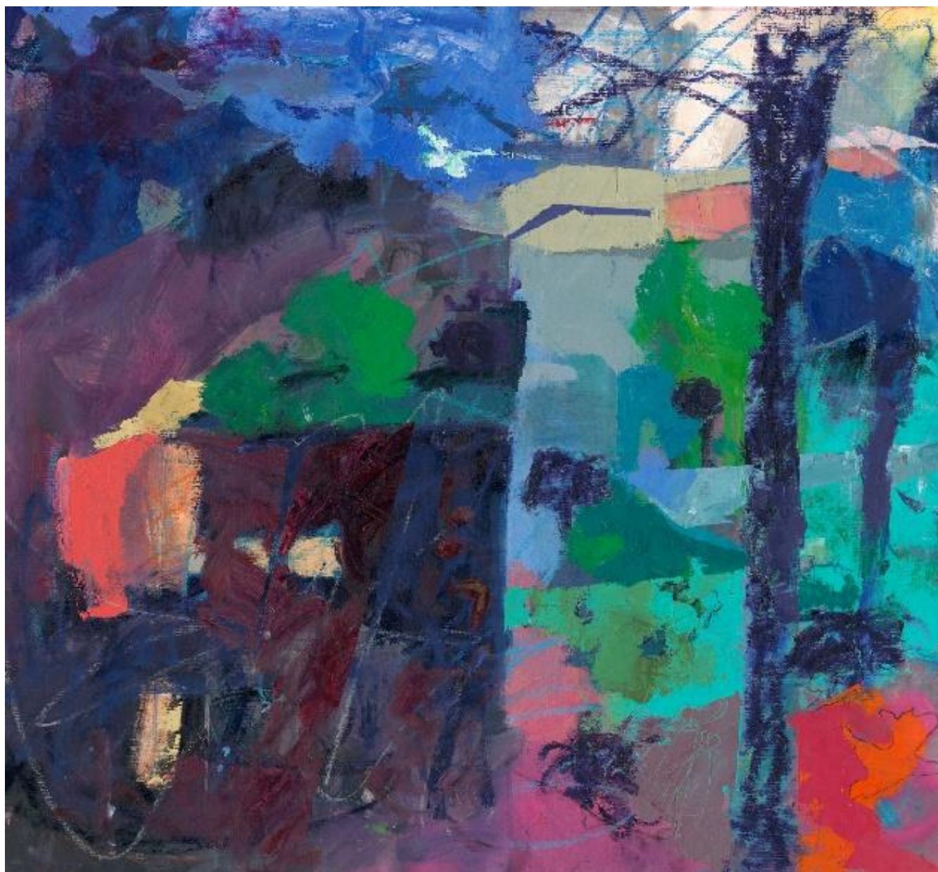
נוף, 2024, שמן על בד, 95X85 ס"מ