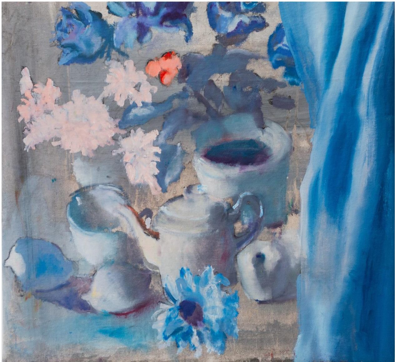
טבע דומם עם וילון, 2023, שמן על בד, 47X43 ס"מ