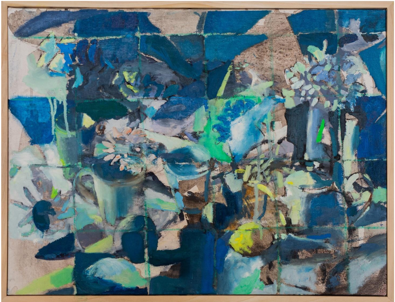
טבע דומם עם גריד, 2024, שמן על בד, 47X64 ס"מ