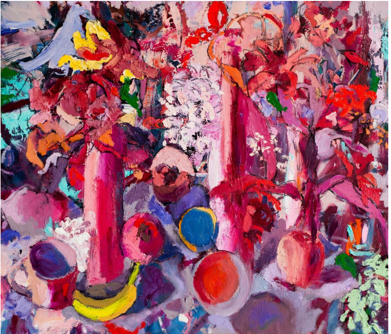
טבע דומם, ורודים 2024, שמן על בד, 72X60 ס"מ