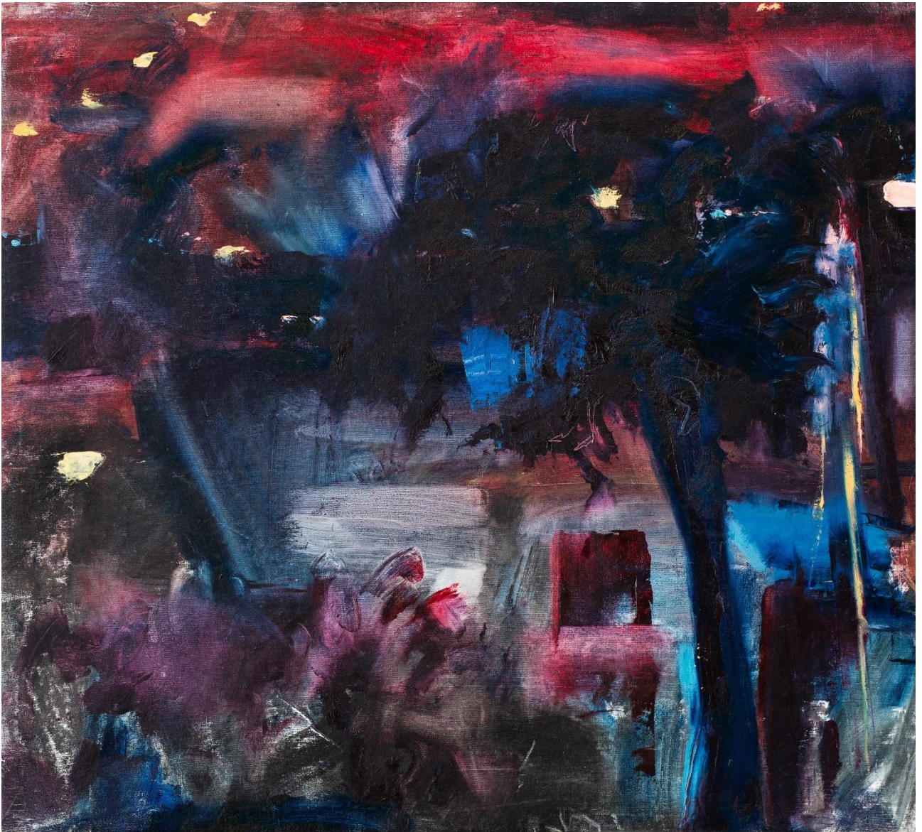
נוף לילי, 2024, שמן על בד, 48X43 ס"מ