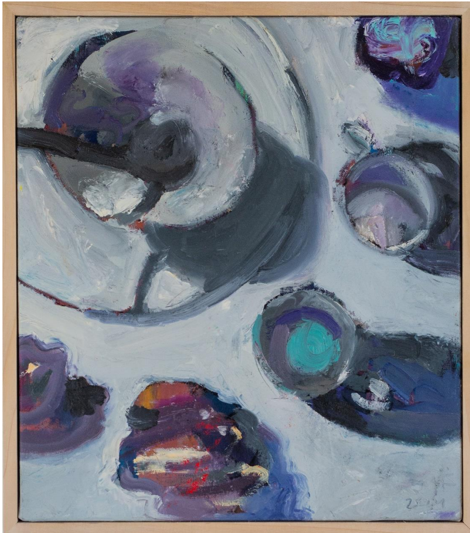
טבע דומם ממבט ציפור, 2024, שמך על בד, 70X50 ס"מ