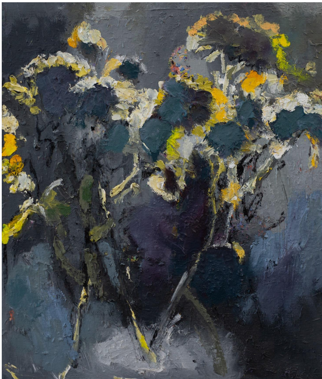
פרחים שקמלו, 2024, שמן על בד, 48X43 ס"מ