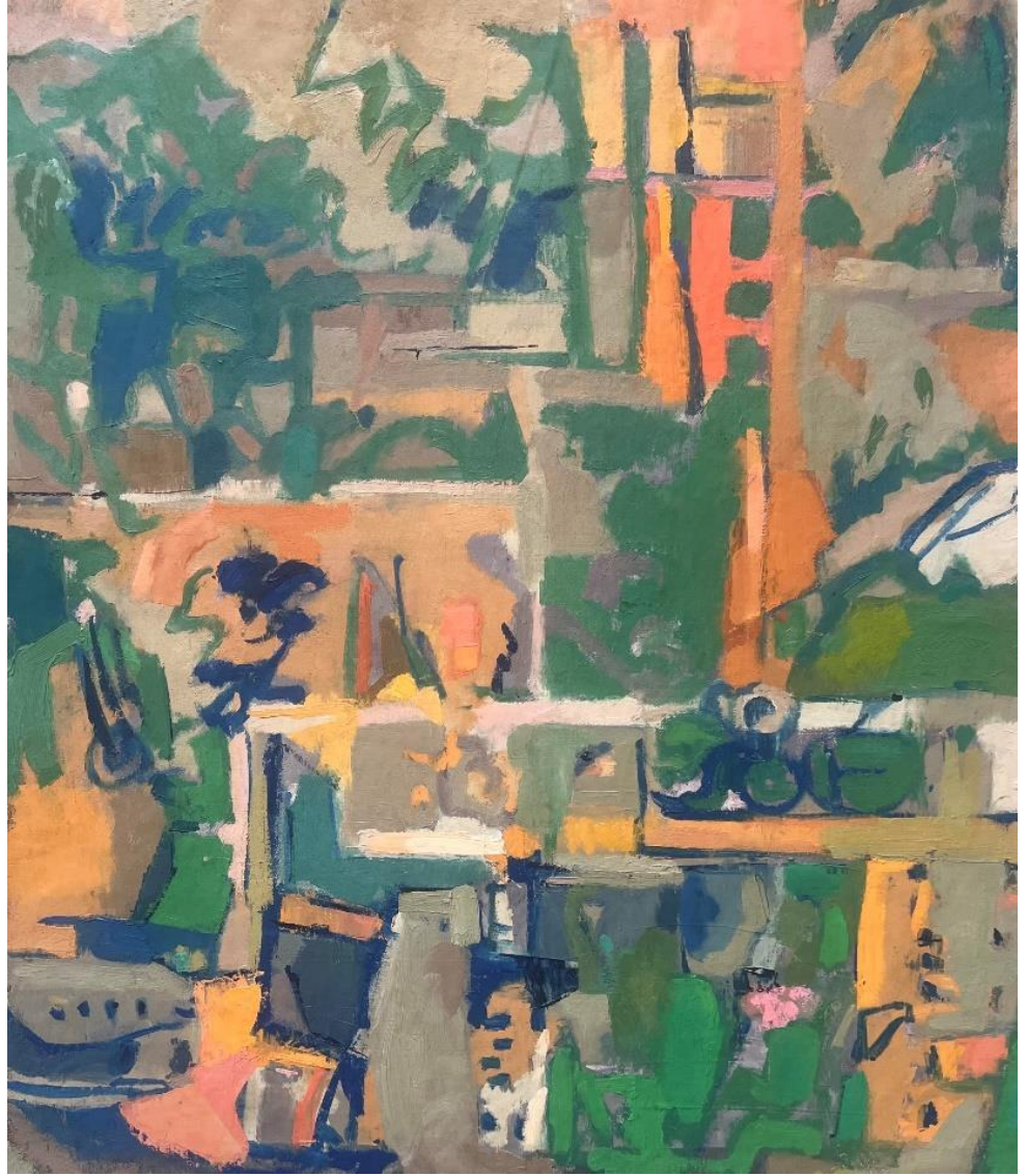
נוף, בהשראת קלימנט, 2024, שמן על בד, 50X40 ס"מ