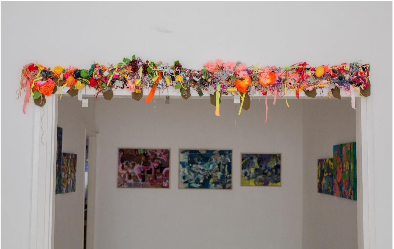
הצבה , תערוכת יחיד, "אשר הביא הגשם", גלריה מרי, ירושלים 2024