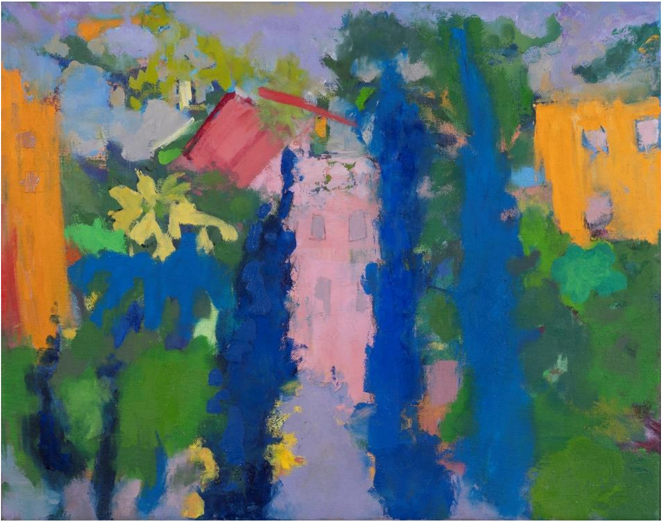
פשוט נוף, 2023, שמן על בד, 40X50 ס"מ