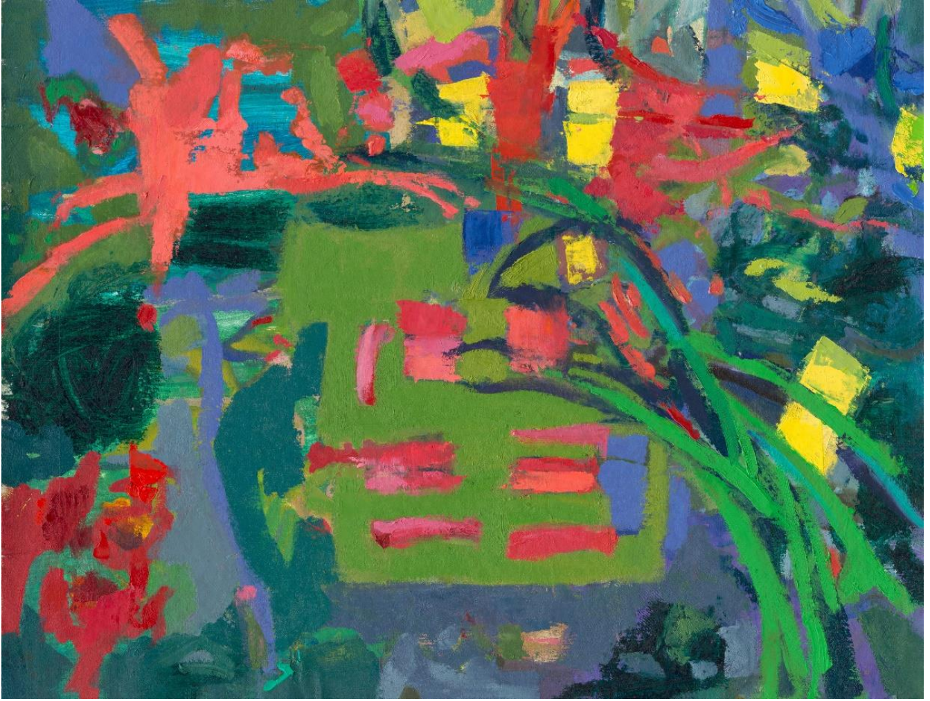
נוף, 2024 שמן על בד, 40X50 ס"מ