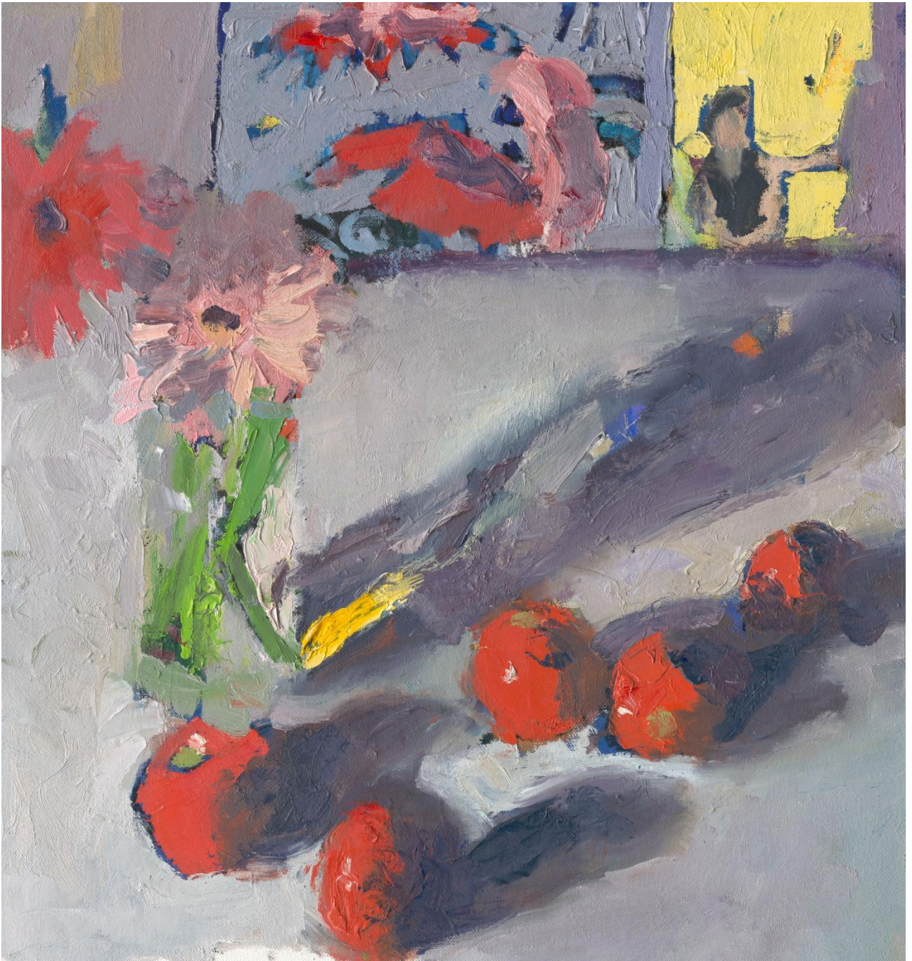
טבע דומם ודמויות, 2023, שמן על בד, 45X45 ס"מ