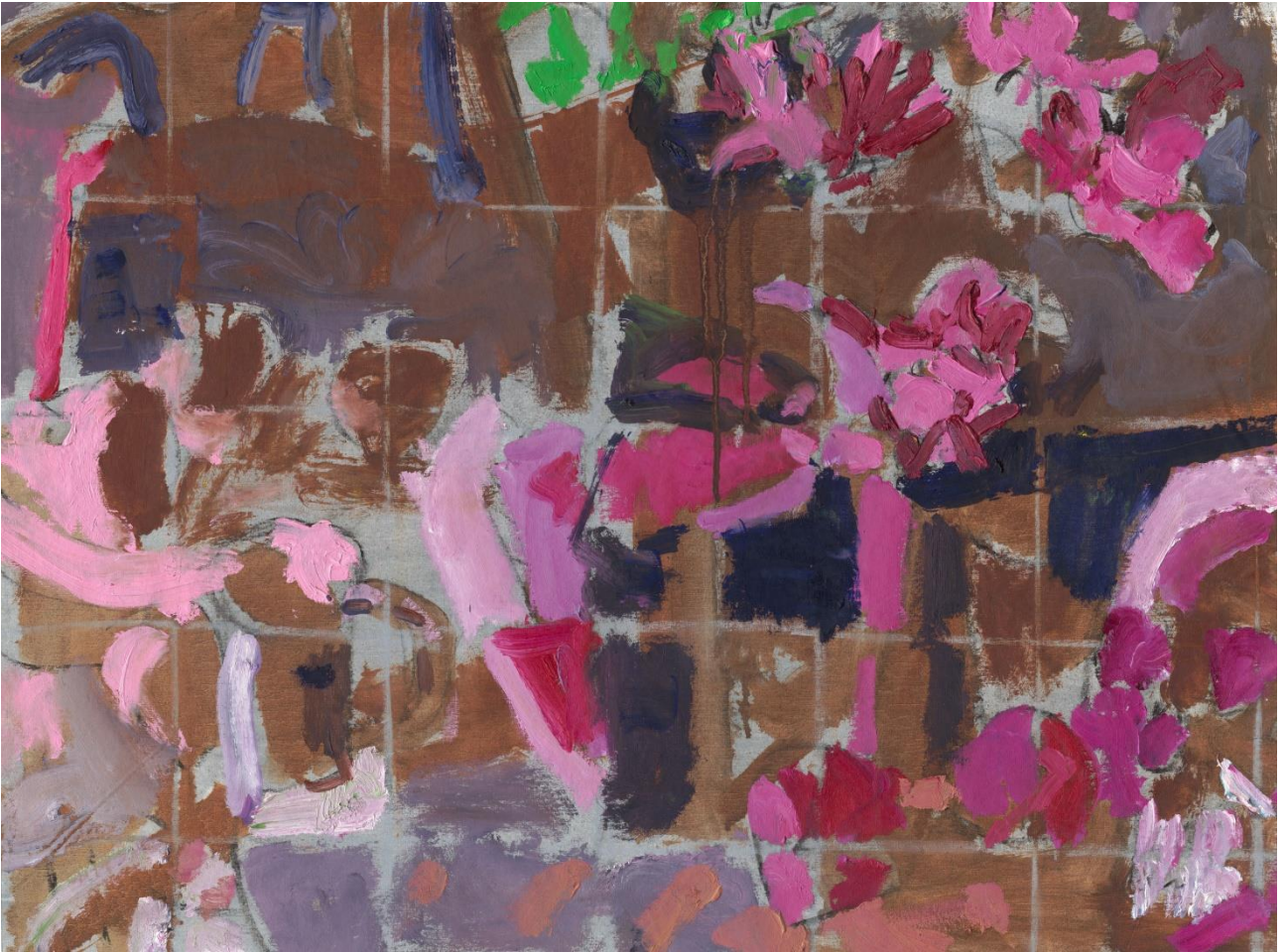
טבע דומם עם גריד, 2024, שמן על בד, 50X60 ס"מ