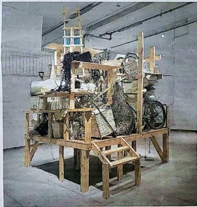
"שרבים", 1985-2022