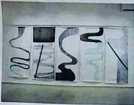
"נודדים בהק"ק", 2022