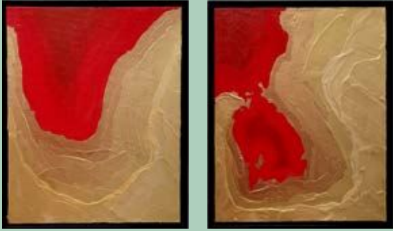
פוסטר מלصق Poster פצע, צבעי אקריליק ושמון על בד جرح، أكريليك وزيت على قماش Wound, acrylic and oil on canvas 30x40 2022