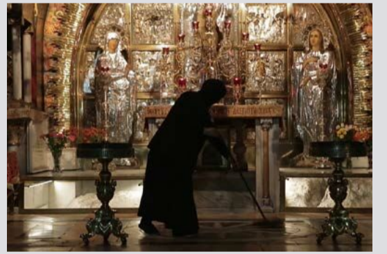
רן סלוין רן סלאפין Ran Slavin

עשן ומראות, וידאו שלושה ערוצים וקול דחן ומריא, فيديو ثلاث قنوات وصوت Smoke and Mirrors, 3-channel video with sound