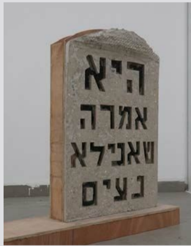
פז שר פז שיר Paz Sher ללא שם, עירוב טכניקות בדון ענון, תפניות מחלטה Untitled, mixed media 2019 20x90x77