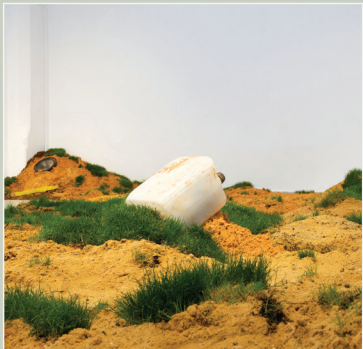
בר ערן Bar Eran

מידות משתנות, مقاييس متغيرة, Variable dimensions 2022