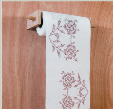
חמוטל בר כהן Chamutal Bar Cohen

מידות משתנות, مقاييس متغيرة, Variable dimensions 2021-2022